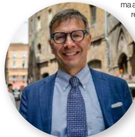
Luigi De Mossi Sindaco di Siena

Festival della salute non abbiamo dato solo il patrocinio, ma abbiamo deciso di partecipare attivamente. Del resto la storia della città è anche storia sanitaria e per questo il nostro proponimento è proseguire con questa collaborazione facendo di Siena la sede naturale del Festival anche per i prossimi anni. Credo molto in questo evento perché tutti insieme possiamo fare tanto.